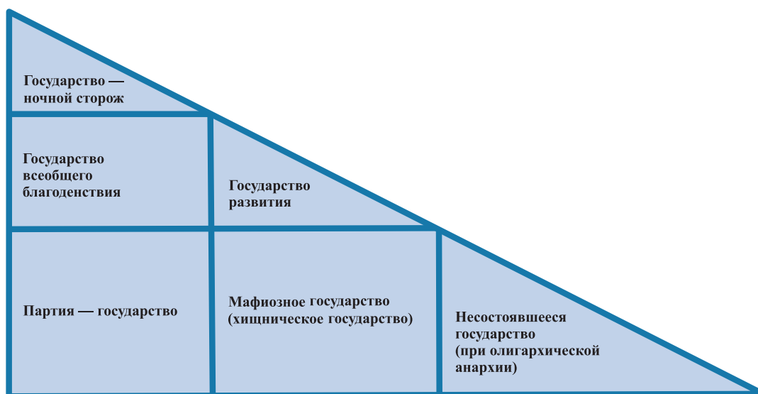
Рис. 2. Типы государств